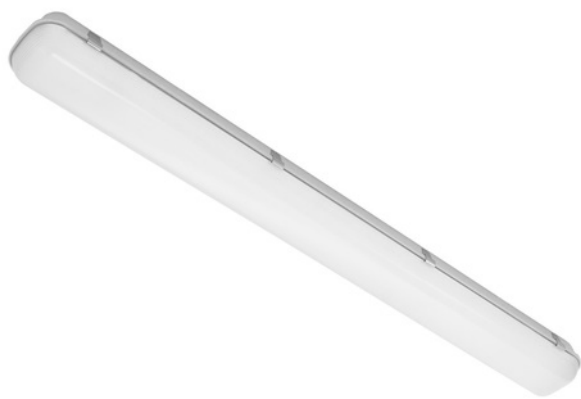
typ svítidla A

Typ A svítidlo LED přisazené liniové, nestmívatelné, 1x32W, zdroj 700mA, IP65, IK08, 4400lm, 4000K, CRI 80-89, korpus plastový, barvy šedé, opálový kryt, distribuce světla symetrická, výstup světla přímý, rozměry 1575 x 84 x 100 mm, např. typ PL3500L1N4ND